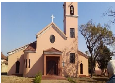
De parochiekerk Sint Johannes de Brito