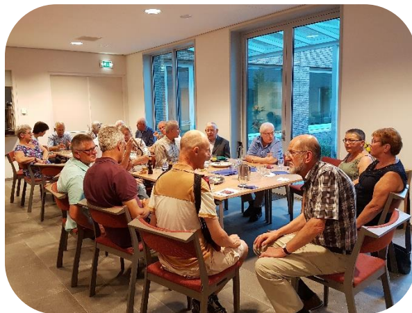
Vrijwilligersbijeenkomst in de tuinzaal

versieren van de kerk, het verzorgen van de kosterij, de liturgie, de inzet van acolieten, lectoren, cantors, collectanten, en voorgangers. Het verwelkomen van de mensen, het orgel, de gezangen, het bijhouden van kerk en klooster en de tuin, het maken van lijsten, het aansturen van de verschillende groepen bijvoorbeeld voor de filmavond, de bijbelgroep, het contactblad, het maken